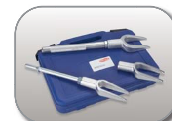
Delphi Ref. BSS1010