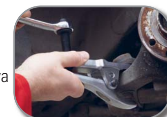
Delphi Ref. BSS1004